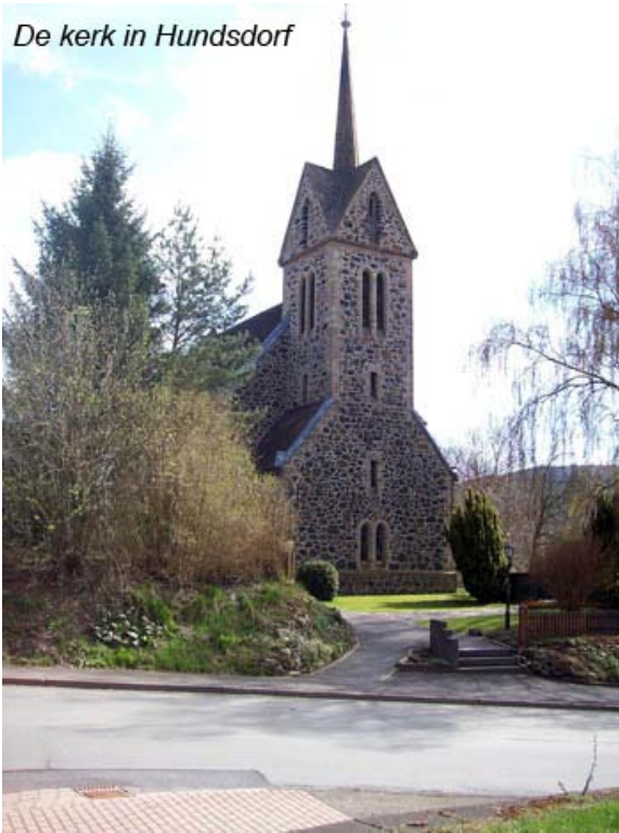
De kerk in Hundsdorf

Op een gegeven moment vlakt de hellingshoek weer af en hebben we een redelijk vlakke wandeling. We komen op een kruising en gaan hier rechtdoor. Op dit pad passeren we op een gegeven moment aan onze rechterhand een paar belangrijke bronnen.