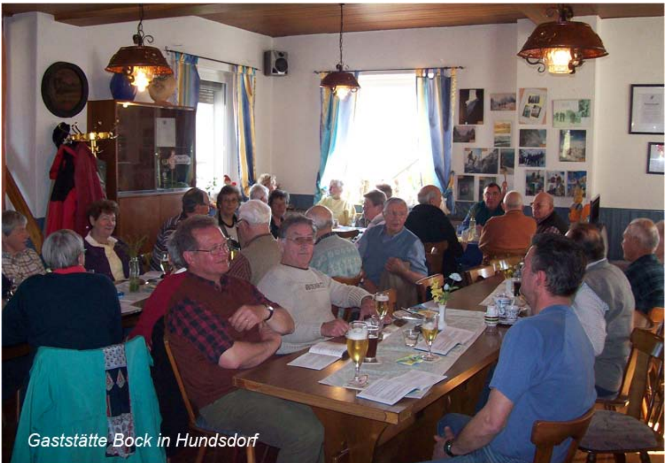
Gaststätte Bock in Hundsdorf

Tegenover de parkeerplaats bevindt zich overigens Gaststätte Bock. Hier kunt u niet alleen terecht voor een verfrissing, maar ook voor een goede maaltijd.