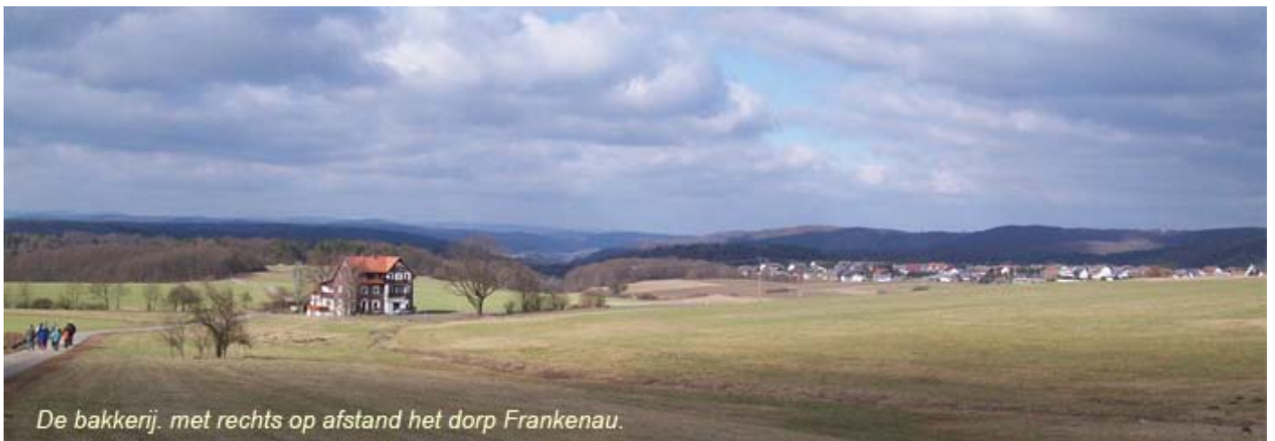
De bakkerij. met rechts op afstand het dorp Frankenau.

Op de zijkant van de bakkerij is overigens een grote beschildering aangebracht, waarvan ik u de inhoud hier niet ga verraden: dan is de lol er af. En ... het is natuurlijk onsportief om met de auti bij de bakkerij te stoppen om te kijken wat er op die muurschildering staat.