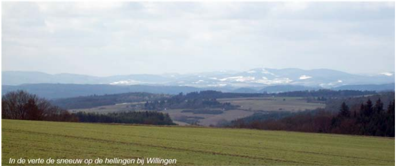
In de verte de sneeuw op de hellingen bij Willingen

Bij de kruising (3) slaan we af naar links en volgen het pad, dat even later naar rechts afbuigt.