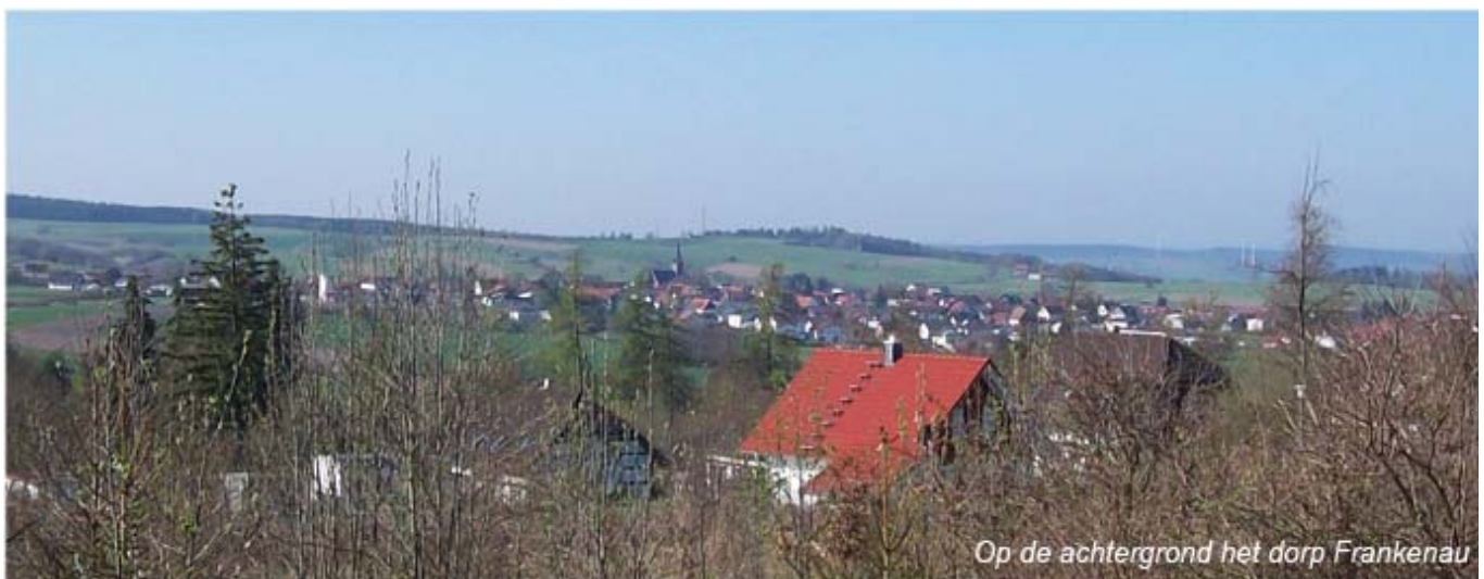
Op de achtergrond het dorp Frankenau

Aan het eind van dit pad komt u vlak voor de eerste vakantiehuisjes op een T-splitsing (3). Hier gaat u rechtsaf, weer het bos in.