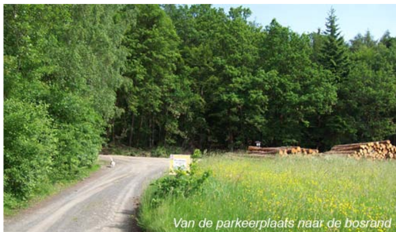
Van de parkeerplaats naar de bosrand

Op deze kruising (3) slaan we linksaf. We wandelen nu op de Köhlerhüttenweg.